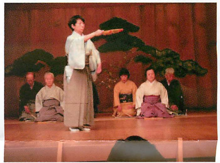
（金春流 高砂やを謡おう会・都筑）